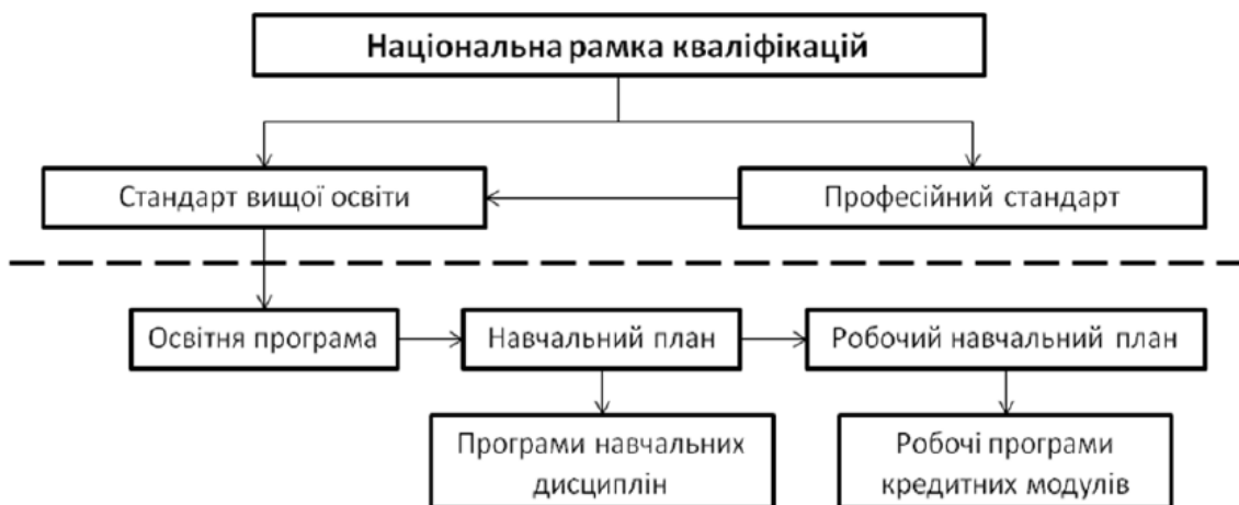
Рис. 1. Структура розроблення змісту освіти і навчання

Нормативні документи верхньої частини схеми (національна рамка кваліфікацій, професійні стандарти та стандарти вищої освіти) розробляються на рівні держави і затверджуються відповідними державними органами. Документи нижньої частини схеми розробляються й затверджуються в університеті.